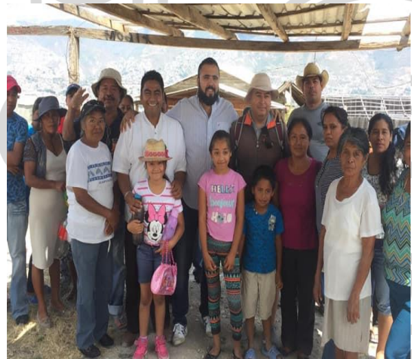
24 de marzo del 2019. Visita a varias colonias de Chilpancingo; siempre es un gusto poder saludar a mis paisanas y paisanos.