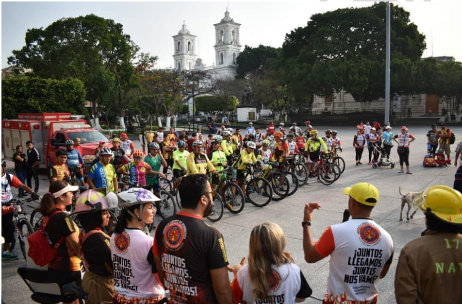
26 DE MAYO 2019. Rodada y caminata en beneficio del Heroico Cuerpo de Bomberos de Chilpancingo.