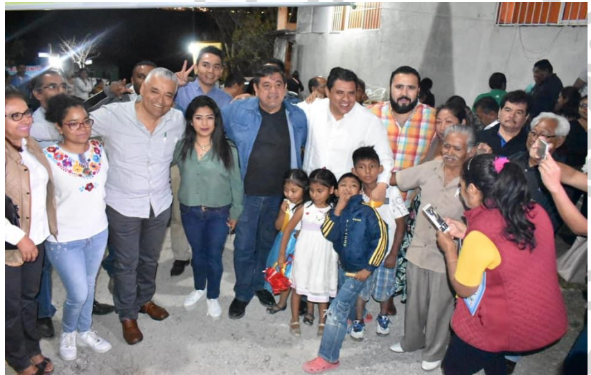
1 de abril del 2019. Acompañando al Alcalde de Chilpancingo, Antonio Gaspar Beltrán, y al Senador de la República, Félix Salgado Macedonio, inauguró la ampliación de la red eléctrica en la Col. La Nevada.