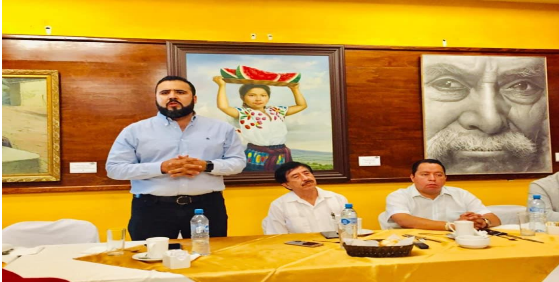
7 DE JUNIO DE 2019. En representación de la fracción parlamentaria del PRD, asistí al convivio que organizó la Dirección de Comunicación Social del Congreso local con columnistas, reporteros y fotógrafos con motivo del Día de la Libertad de Expresión.