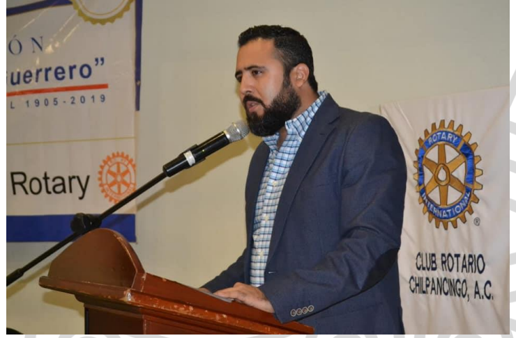
1 de marzo del 2019. En el marco de la conmemoración del 114 aniversario de Rotary International.