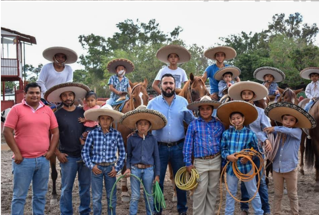
5 DE JUNIO DE 2019. Visita a mis amigos charros infantiles.