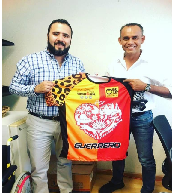
20 DE AGOSTO DE 2019. Apoyo a deportistas de alto rendimiento del Estado de Guerrero.