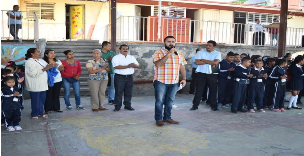
1 de abril del 2019. Rindiendo honores a nuestro lábaro patrio en la escuela primaria Aarón M. Flores de la Col. CNOF.