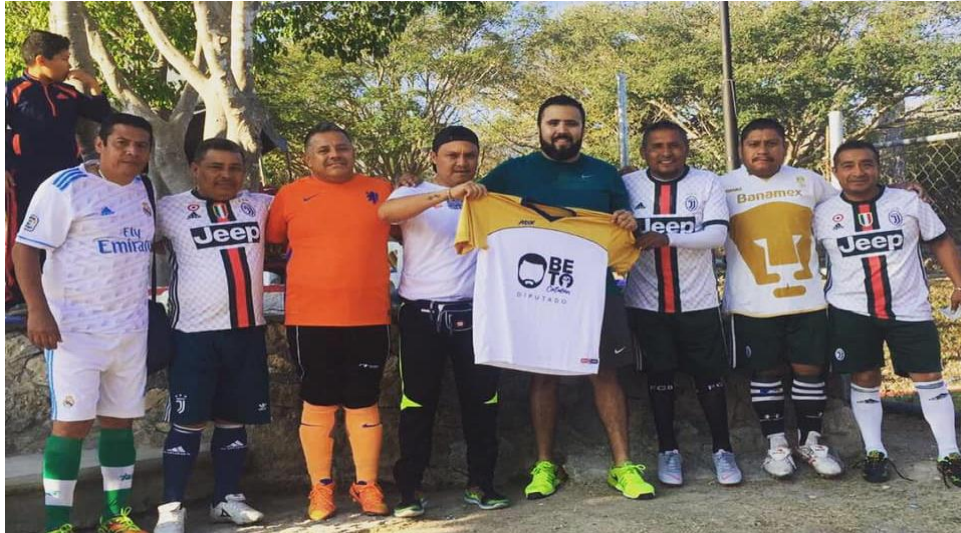
2 marzo del 2019. Eventos de promoción y fomento al deporte.