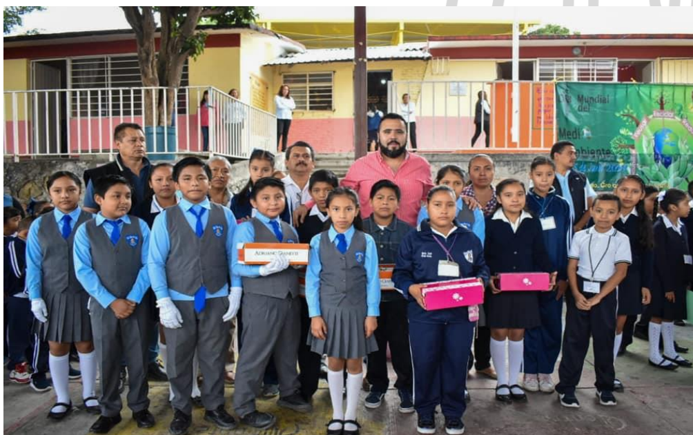
3 DE JUNIO DE 2019. Visita a los alumnos, personal docente y administrativo de la Escuela Primaria Aarón M. Flores, ubicada en la colonia CNOP de Chilpancingo, donde tuve la oportunidad de saludar a los integrantes del Comité de Padres de Familia.