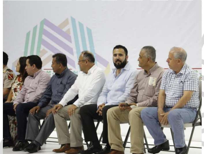
5 marzo del 2019. Presentación del Plan Municipal de Desarrollo de nuestra ciudad capital. El Gobernador del Estado Lic. Héctor Astudillo fue el anfitrión y recibió de manos del alcalde chilpancingueño Antonio Gaspar Beltrán el Plan Municipal de Desarrollo.