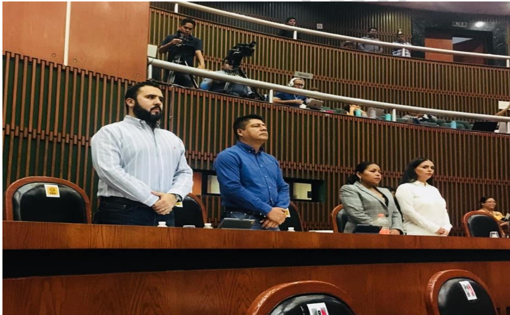
09 de octubre de 2018. Sesión ordinaria en el Congreso del Estado.