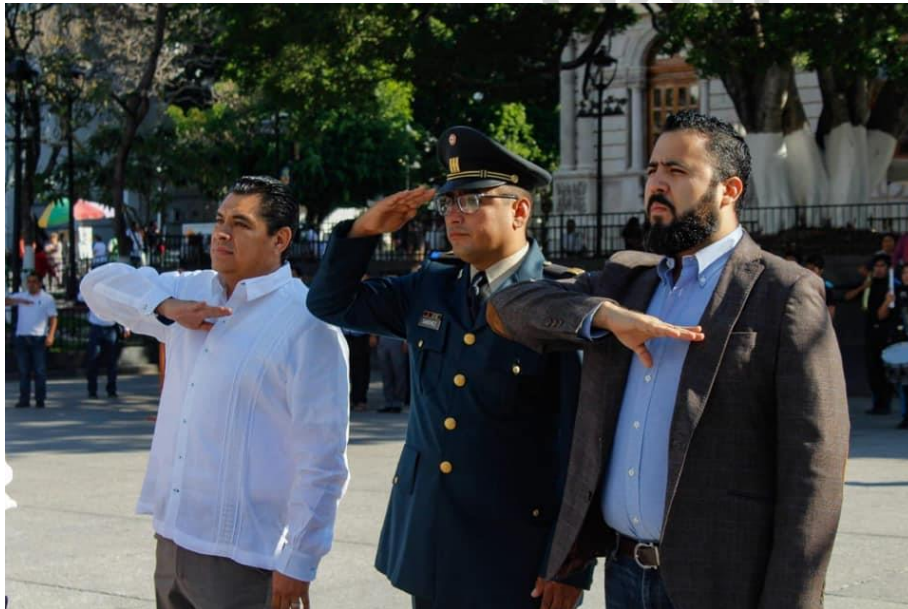
11 marzo del 2019. Acto cívico de honores a la bandera en la explanada de la Plaza Primer Congreso de Anáhuac en el centro de Chilpancingo.