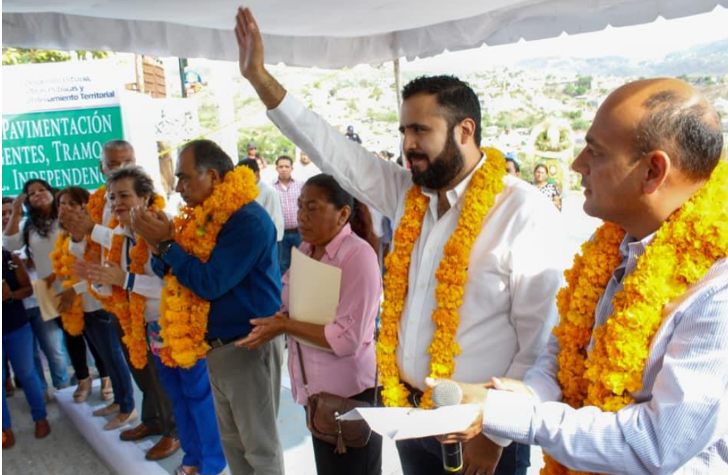
17 DE JUNIO DE 2019. Inauguración de la calle principal de la Col. Independencia en Chilpancingo.