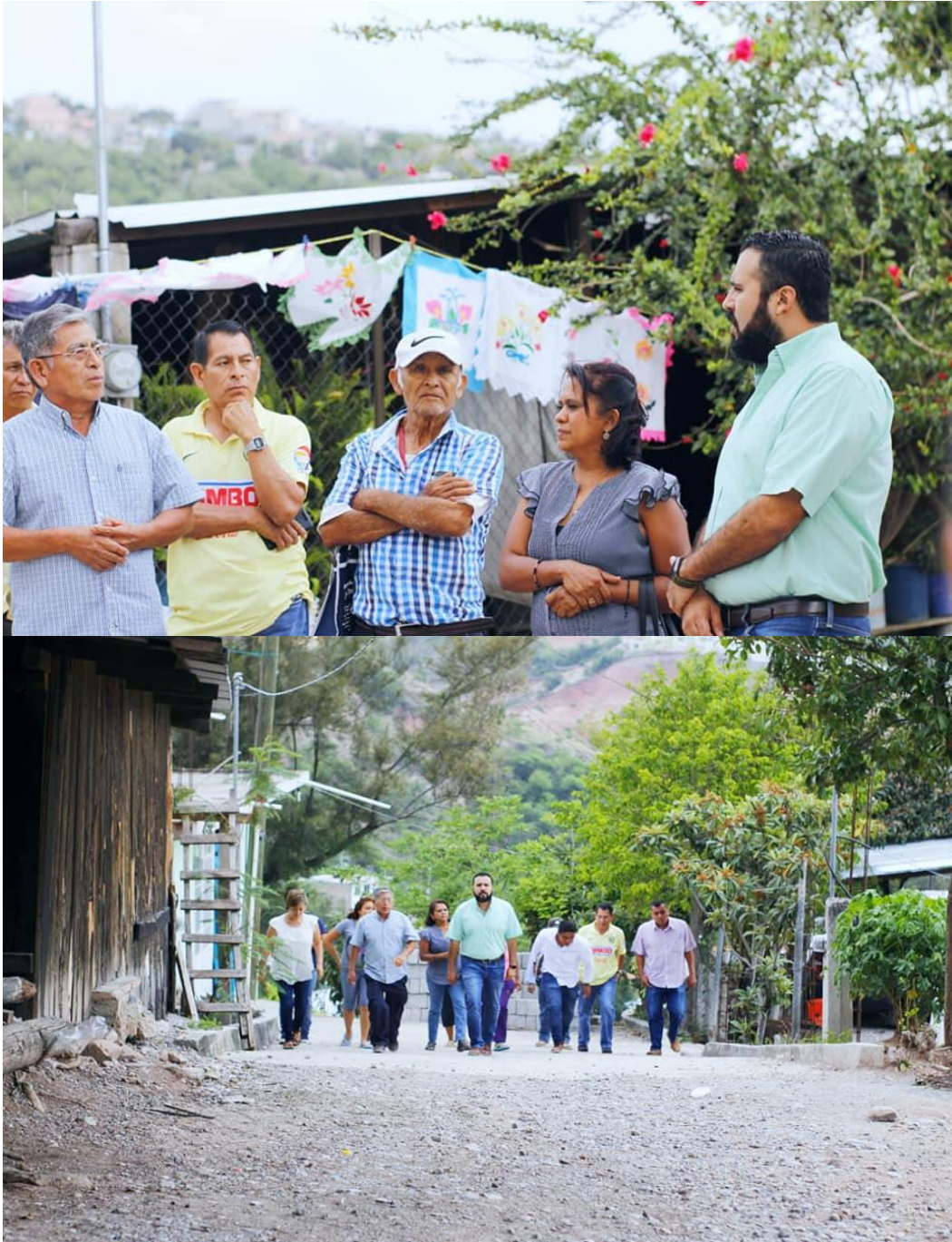
9 DE JULIO DE 2019. Visita a la colonia Plan de Ayala.