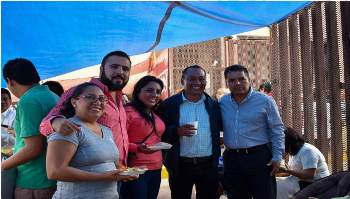
3 DE JUNIO DE 2019. Campamento de los trabajadores sindicalizados del Congreso Local.