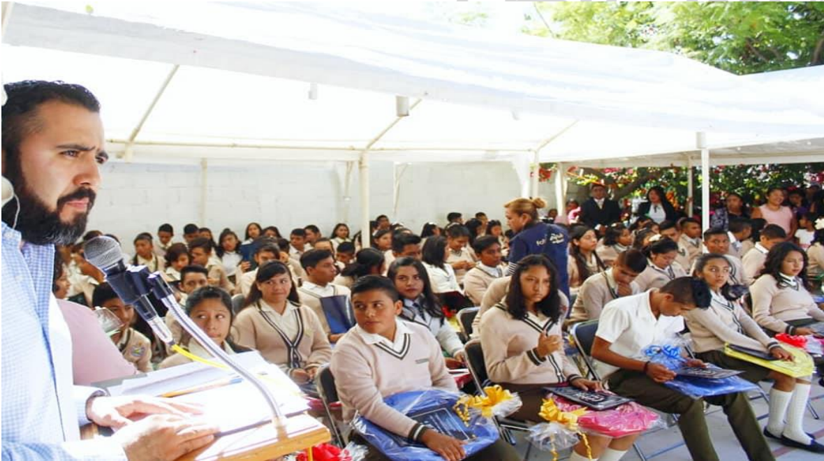
8 DE JULIO de 2019. Padrino de la generación 2016-2019 de la telesecundaria Emiliano Zapata egresó esta mañana en una ceremonia llena de emotividad.