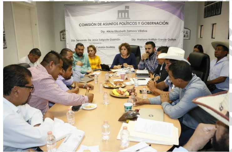
23 de enero del 2019. Sesión la Comisión de Asuntos Políticos y Gobernación del H. Congreso del Estado. Atendimos a representantes de los comités gestores para la creación de nuevos municipios, dictaminamos asuntos competentes a dicha comisión y escuchamos a pobladores del El Renacimiento, comunidad del Municipio de San Luis Acatlán.