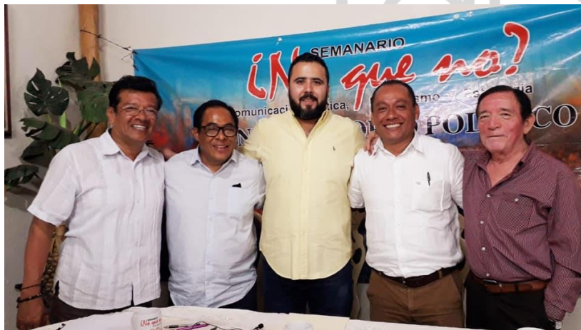
17 de enero 2019. Conversatorio Político