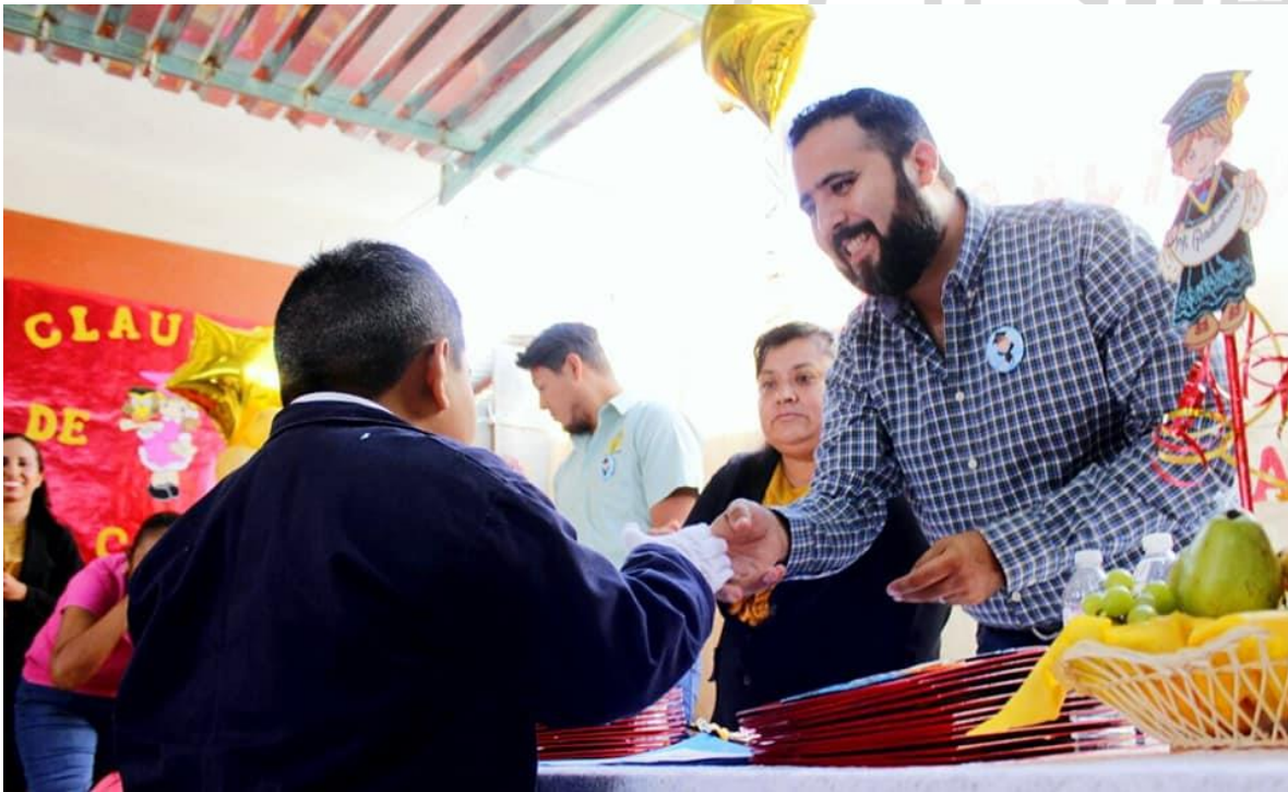
3 DE JUNIO DE 2019. Acompañé a los alumnos y alumnas del kínder Hellen Keller en su graduación, generación 2016-2019.