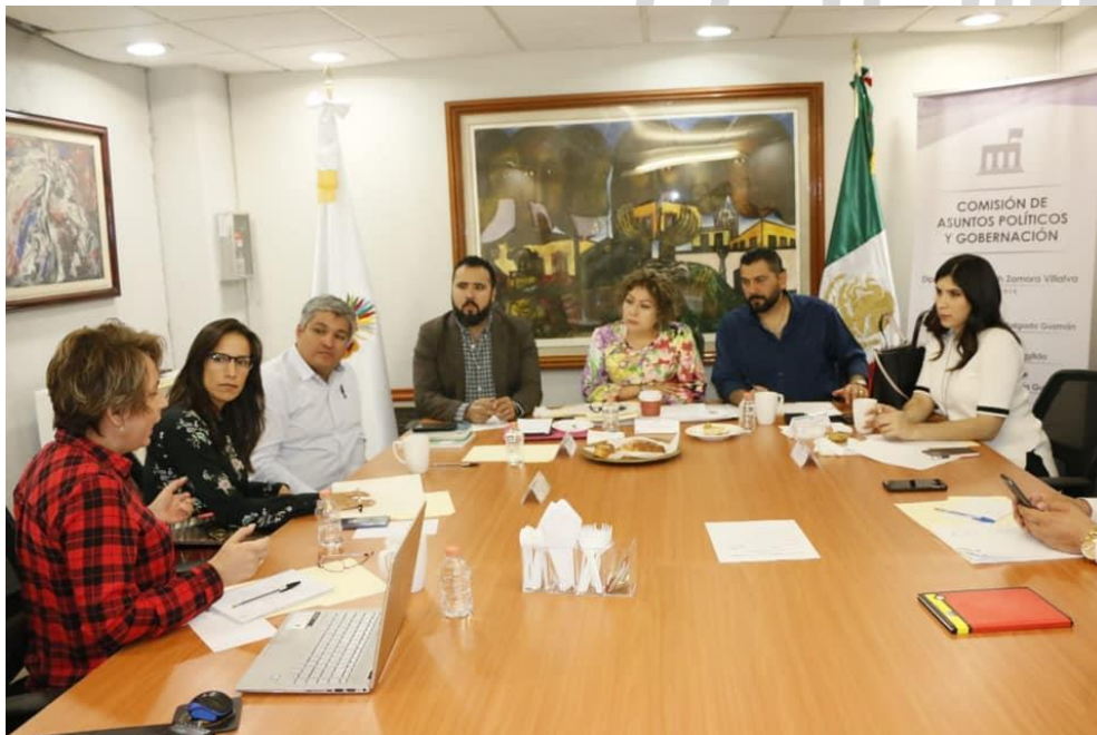
5 de marzo del 2019. Sesión de la Comisión de Asuntos Políticos y Gobernación del Congreso del Estado.