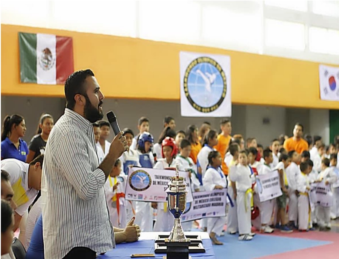
6 DE JULIO DE 2019. Inauguración de la primer copa "Avispón 2019" de taekwondo olímpico en Chilpancingo.