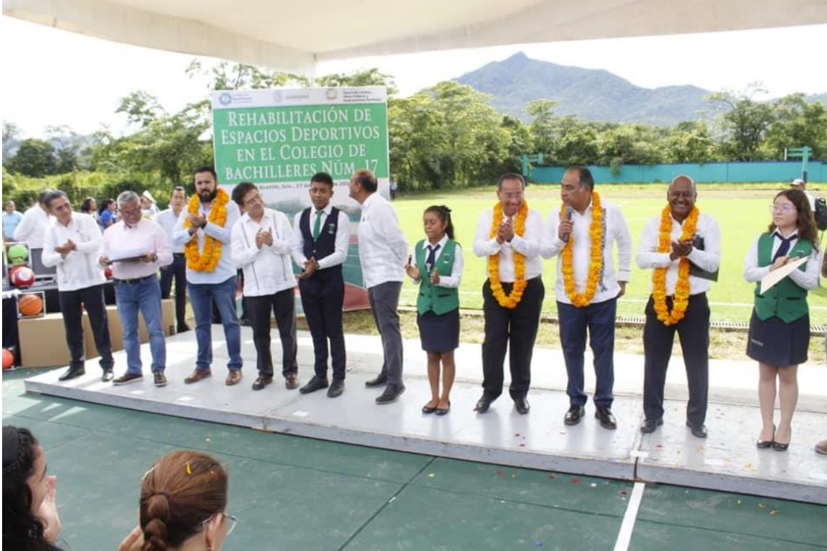
27 DE AGOSTO DE 2019. Inauguración de la cancha de Fútbol con pasto sintético y la cancha de basquetbol en el Colegio de Bachilleres Plantel #17 en el Ocotito, municipio de Chilpancingo.