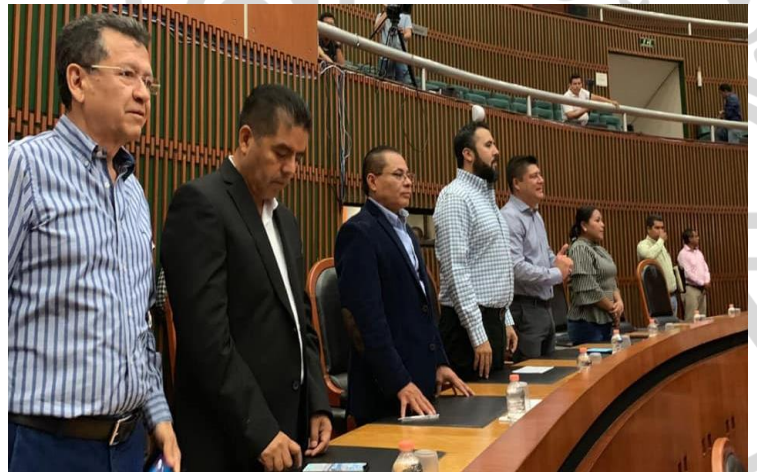
1 de marzo del 2019. Instalación del segundo periodo de Sesiones Ordinarias del Primer Año de Ejercicio Constitucional de la LXII Legislatura al H. Congreso del Estado Libre y Soberano de Guerrero. Guerrero, primer estado en aprobar la Guardia Nacional.