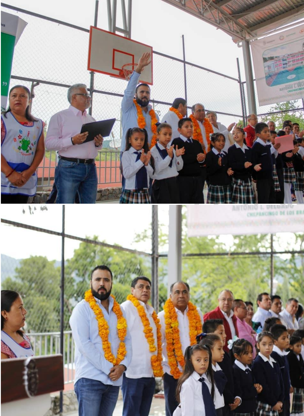
27 DE AGOSTO DE 2019. Inauguración del edificio de la Escuela Francisco Figueroa Mata en Chilpancingo.