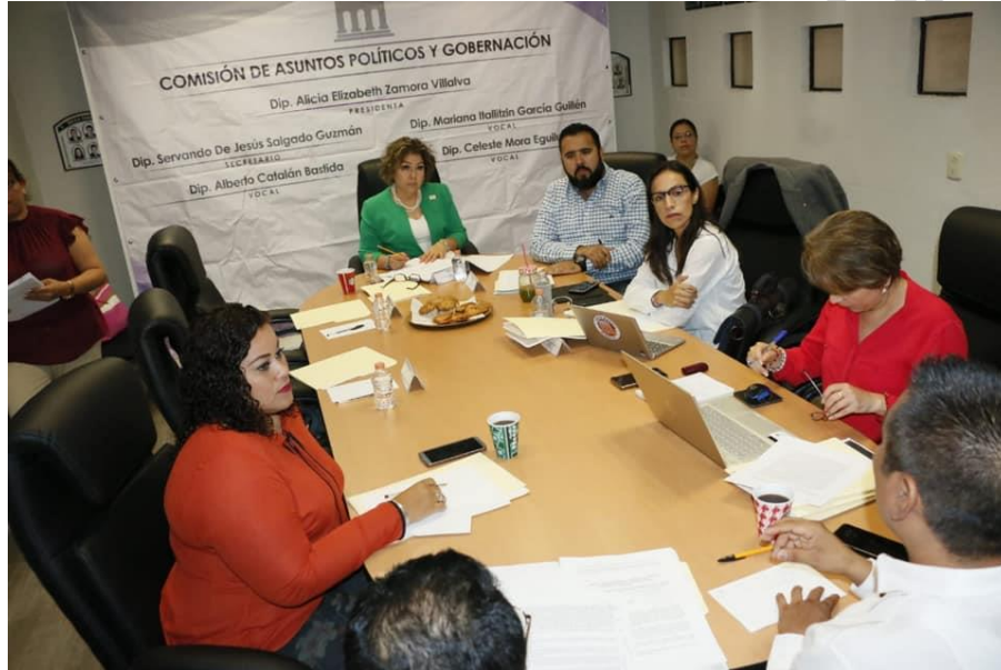
12 de marzo del 2019. Sesión de la Comisión de Asuntos Políticos y Gobernación para atender el conflicto entre dos comunidades pertenecientes al municipio de San Luis Acatlán e Iliatenco, Guerrero.