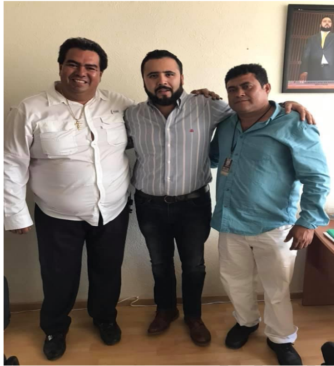
09 de octubre de 2018. Reunión de trabajo con el Presidente del H. Ayuntamiento del Municipio de Marquelia, Gro.