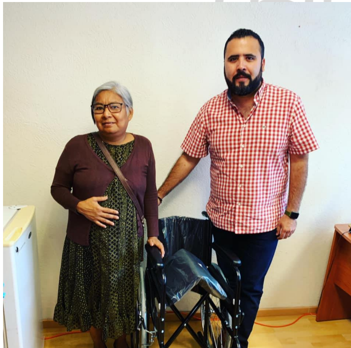
21 DE AGOSTO DE 2019. La solidaridad no es un acto de caridad, sino una ayuda mutua entre fuerzas que luchan por el mismo objetivo. Entrega de silla de ruedas.