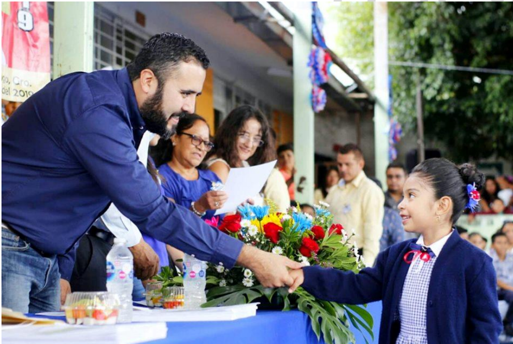
2 DE JUNIO DE 2019. Padrino de generación de la primaria Quetzalcóatl, en Chilpancingo.