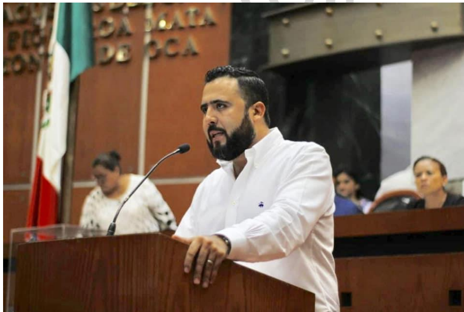
13 de marzo del 2019. Exigiendo se respete a la Comisión de Desarrollo Urbano y Obras Públicas de la LXII Legislatura por parte de los convocantes al Foro "Chilpancingo, Plan Director de Desarrollo Urbano: una visión hacia el futuro"; lamento y rechazo que se utilice de manera oportunista éste órgano del Congreso.