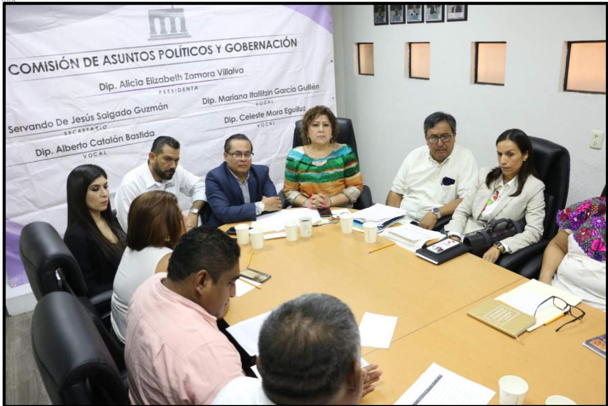
Reunión realizada con Junta de Coordinación Política y la Comisión de Asuntos Políticos y Gobernación. En relación a la creación de municipios Las Vigas, Santa Cruz del Rincón, Ñuu savii y San Nicolas.