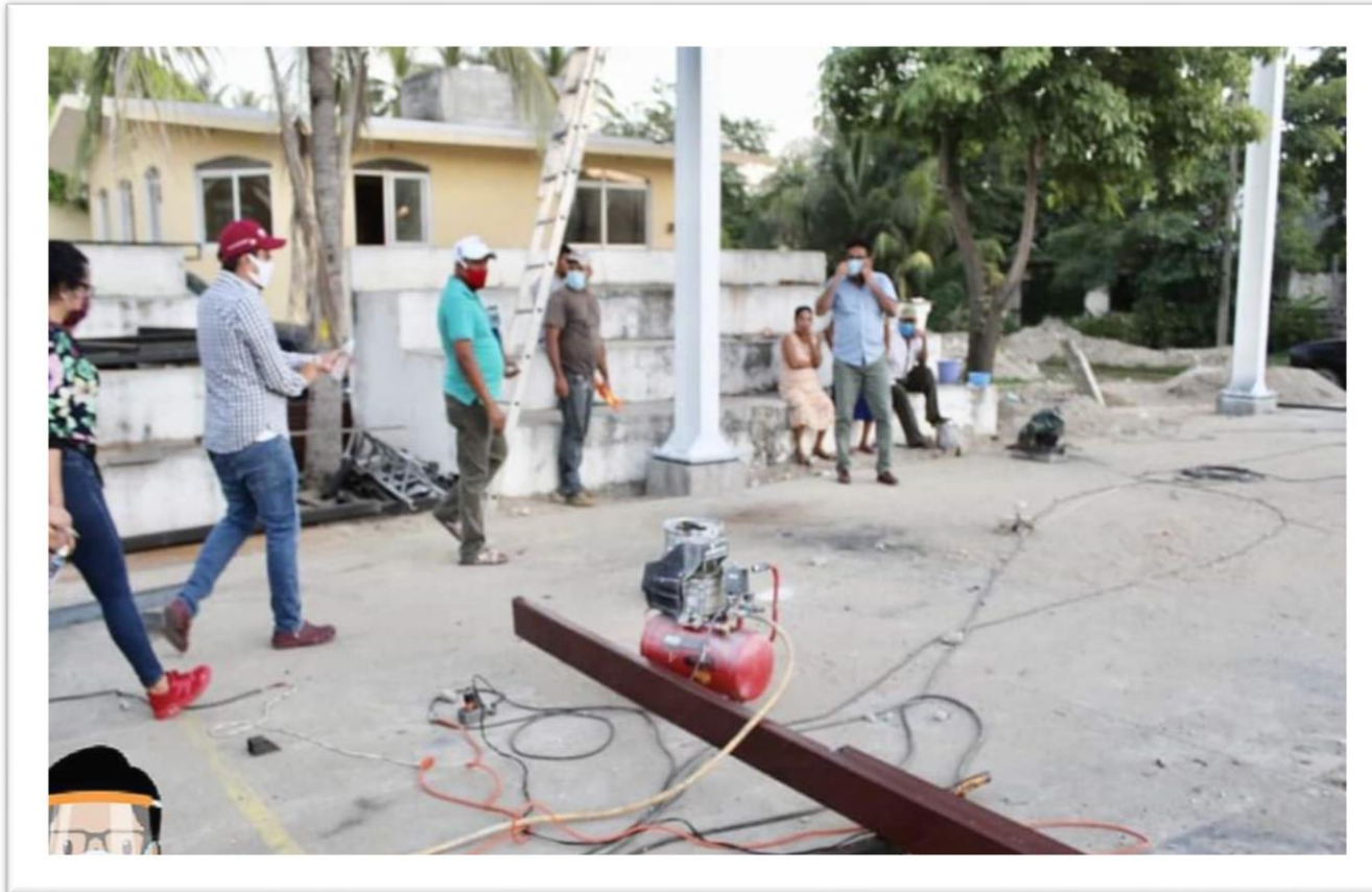
Inauguración del techado en la cancha de San Andrés Playa Encantada.