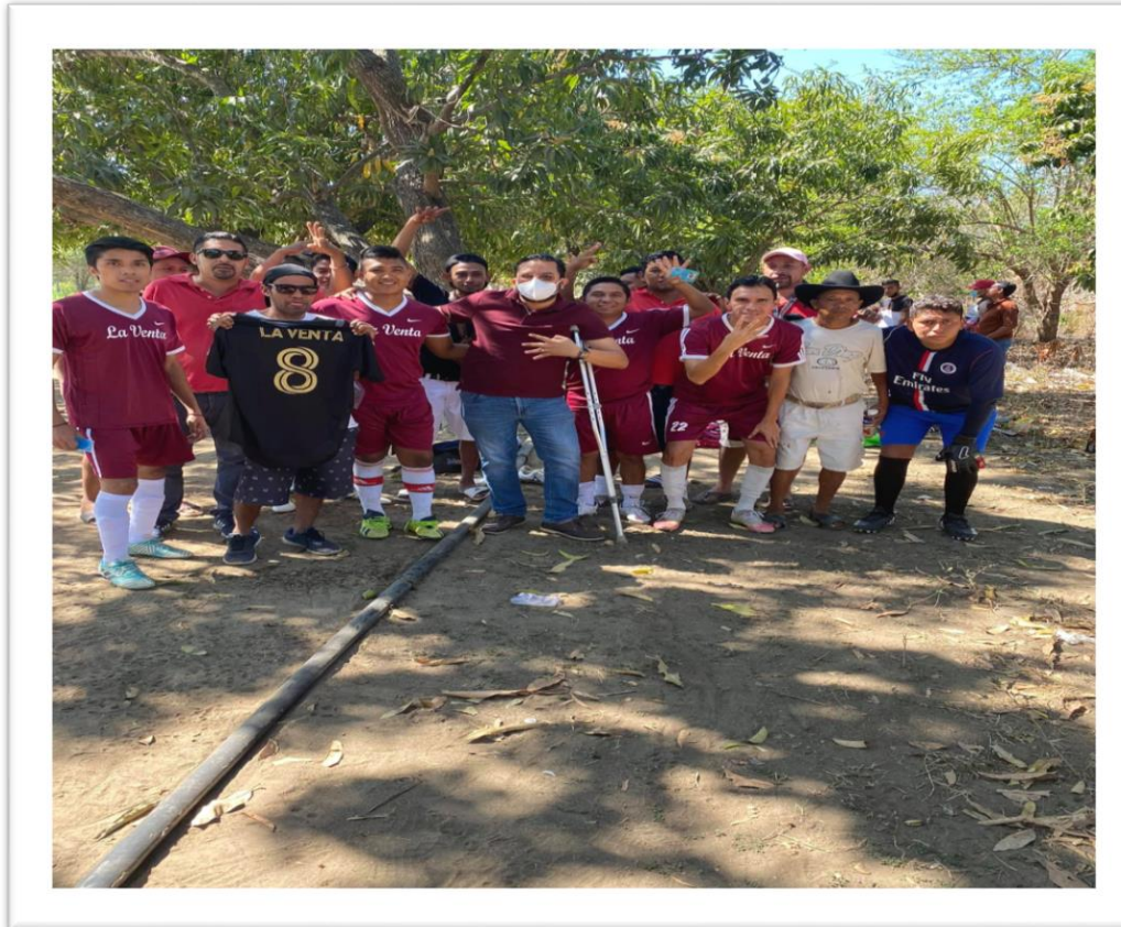
Apoyo con uniformes a las ligas de fútbol del distrito 7.