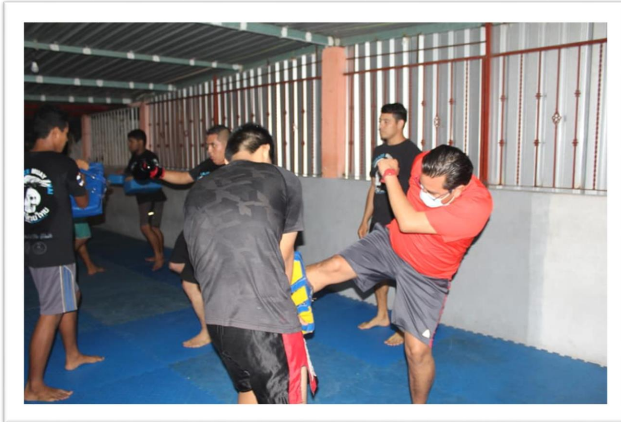
Entrega de kits para entrenamiento a escuela de artes marciales en El Coloso, Acapulco.