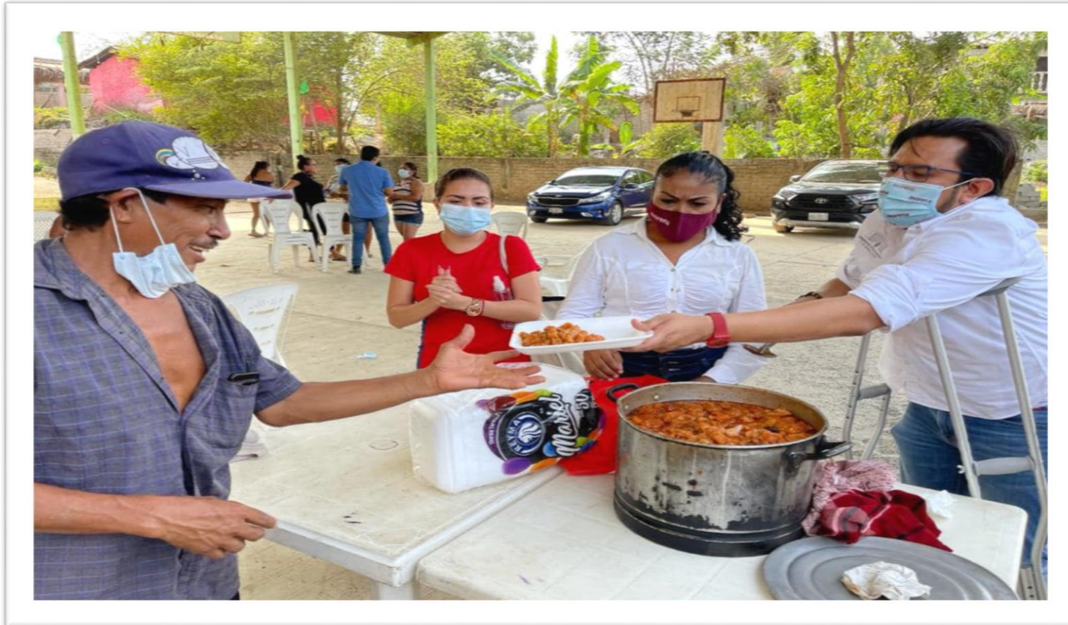
Apoyo a las comunidades rurales con porciones de comida caliente, Col. Josué Azueta.