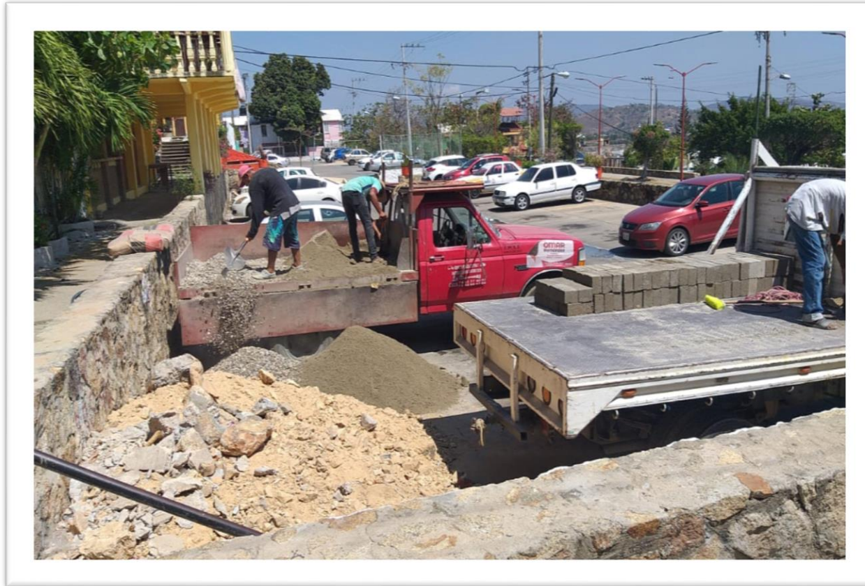
Entrega de material para la construcción de rampa en la Unidad Habitacional Colosio.