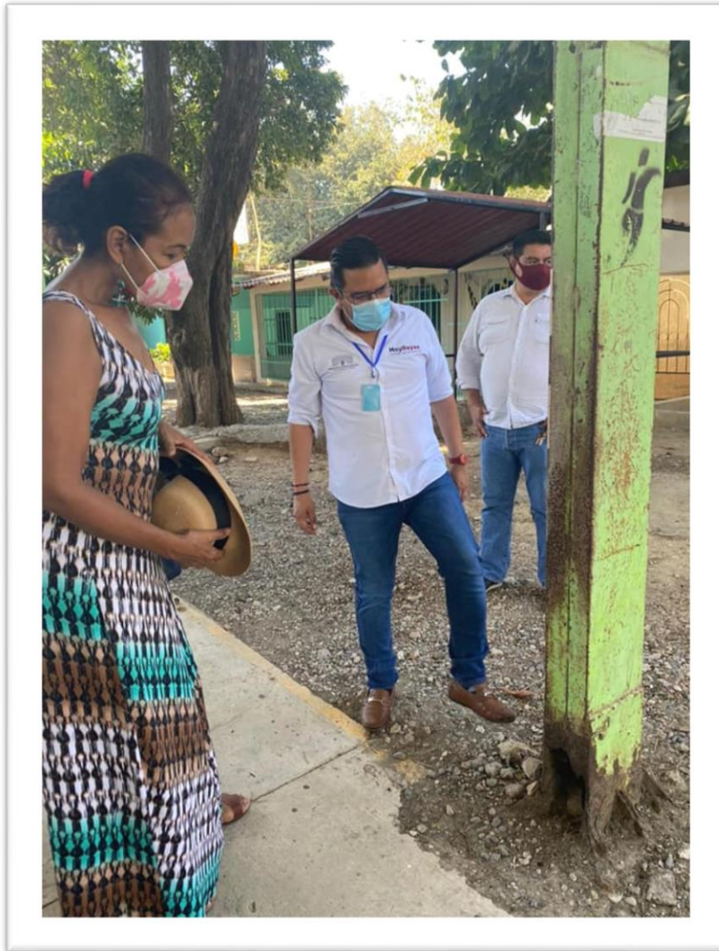
Rehabilitación y construcción de techumbre en la Cancha del poblado del Cayaco.