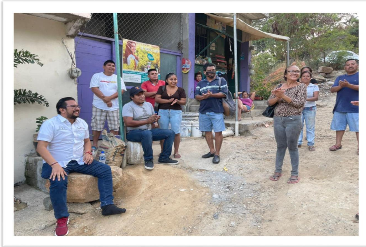
Reunión vecinal en la Col. Dragos para darle solución a la problemática de la regularización de predios.