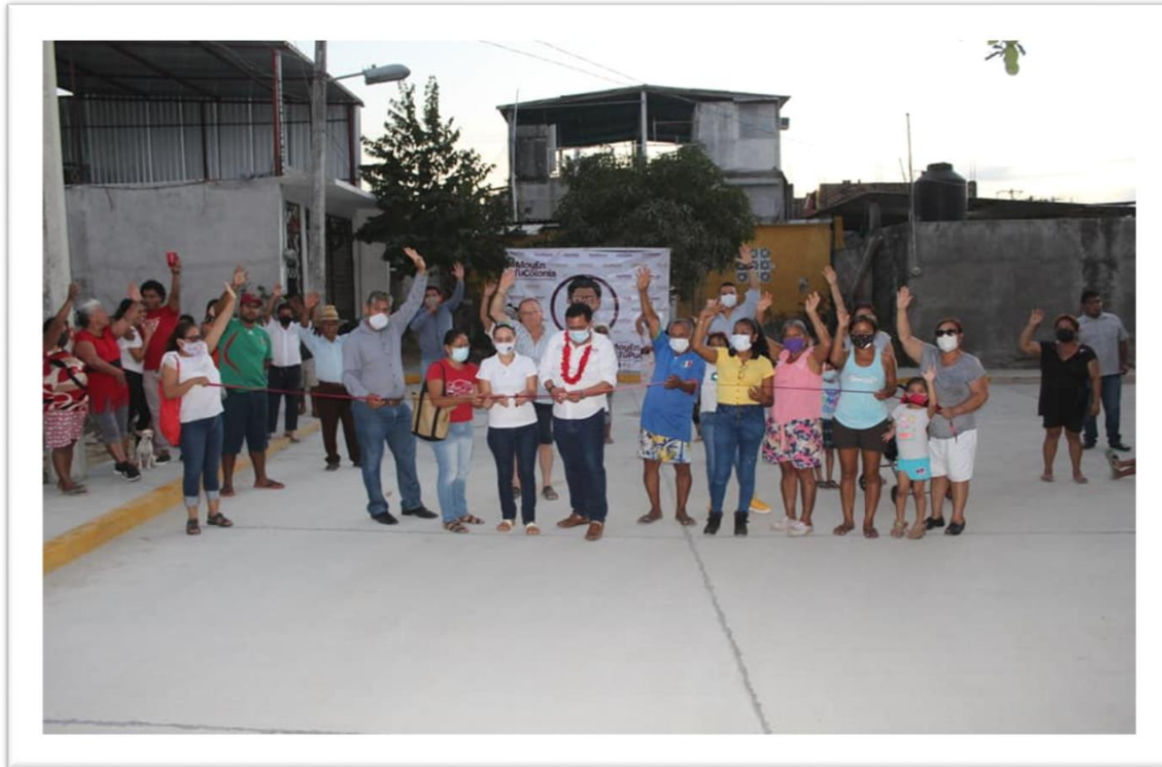
Ejecución del ejercicio presupuestal 2021 con la pavimentación de la calle Luis Donaldo Colosio.