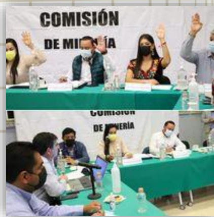
Sesión de la comisión de Minería.