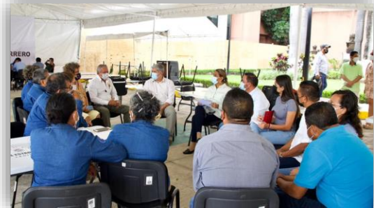
Reunión sobre temas presupuestales con Organizaciones de pensionados del Estado de Guerrero.