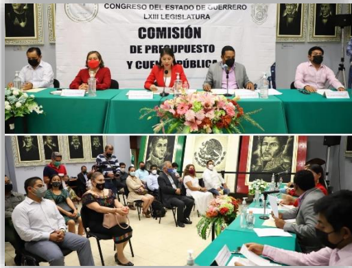
Sesión de instalación de la comisión de Presupuesto y Cuenta Pública.