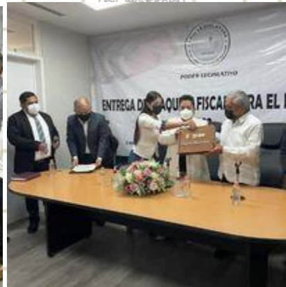
Recepción de la propuesta del presupuesto de egresos 2022.