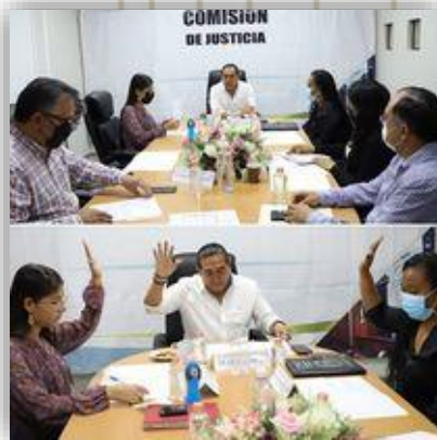
Sesión de la comisión de Justicia.