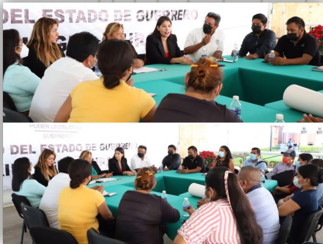
Reunión sobre temas presupuestales con prepas populares.