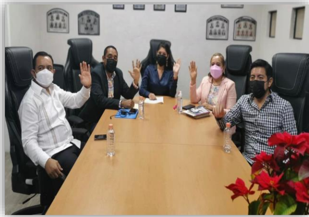
Sesión de la comisión de Presupuesto y Cuenta Pública.