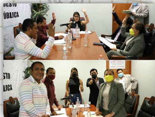
Sesión de la comisión de Presupuesto y Cuenta Pública.