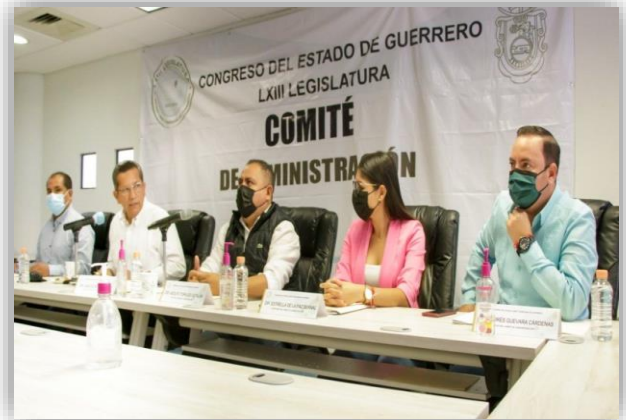
Sesión del Comité de Administración.