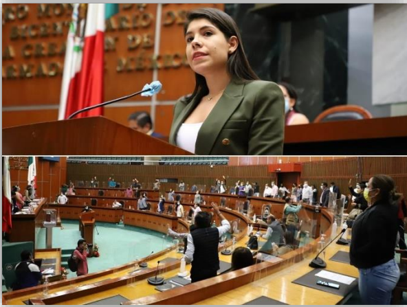
Aprobación por los diputados del presupuesto 2022.