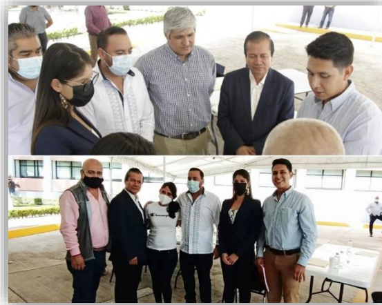
Reunión sobre temas presupuestales con autoridades municipales.